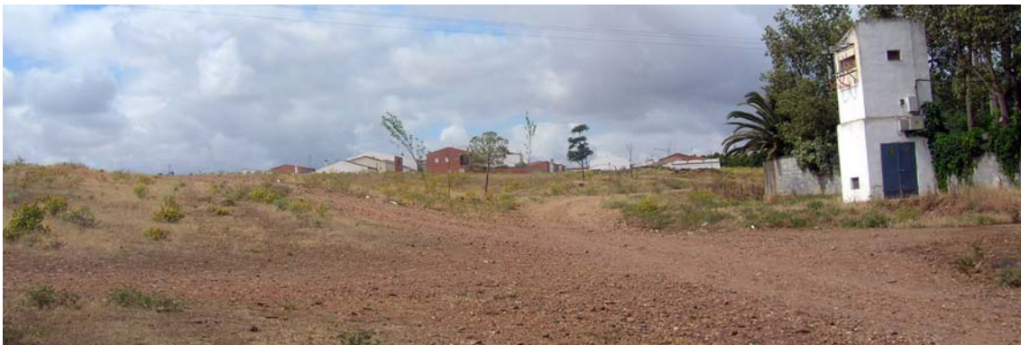
La colada pasa por el transformador cerca de las Monjas.

Cruzada esta última, se aparta por la izquierda la calle del Calvario, que penetra en la población, y la Colada toma el camino de las Traseras dejando el pueblo a la izquierda y llega al Transformador de la Cerca de las Monjas, que queda también en el lado izquierdo.