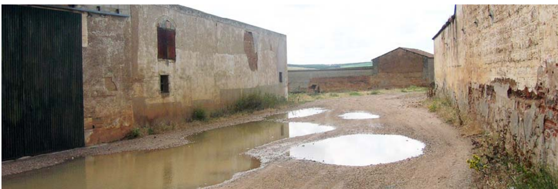
La colada pasa el callejón del pilar dejando al lado el antiguo lavadero.

Sigue por el Callejón del Pilar y, torciendo después a la izquierda, pasa por los Callejones del Pilar dejando a la derecha los Lavaderos y en su parte izquierda el Pozo del Pilar, desde donde vuelve hacia el Norte para cruzar el arroyo de San Juan, terminando así su recorrido al empalmar con la Colada de Valdetorres.