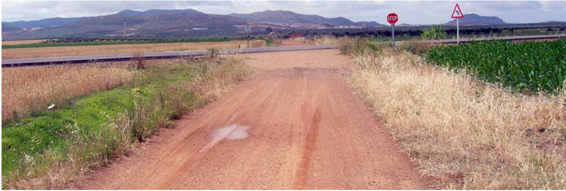
Los cuartillejos. La cañada se acababa y empezaba la colada de circunvalación

Cruzada esta última, se aparta por la izquierda la calle del Calvario, que penetra en la población, y la Colada toma el camino de las Traseras dejando el pueblo a la izquierda y llega al Transformador de la Cerca de las Monjas, que queda también en el lado izquierdo.