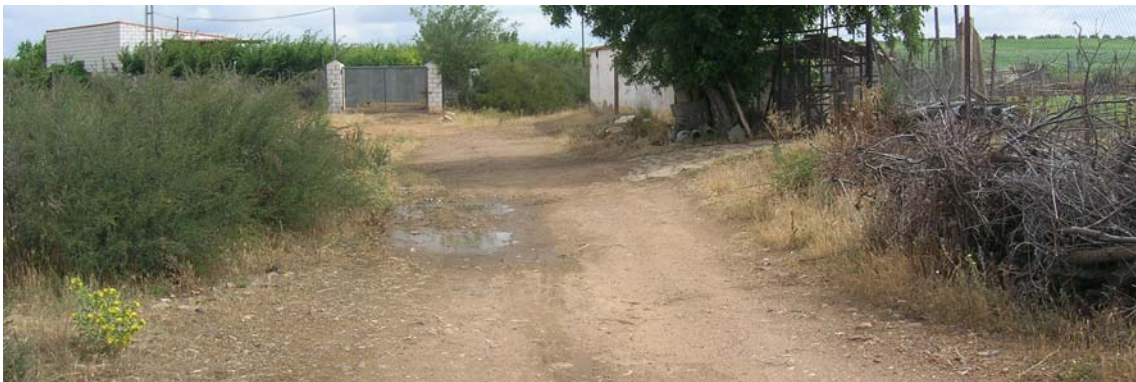
Una vez pasada el arroyo San Juan comienza la Colada de Valdeterres

Colada de Valdeterres.- Tiene una anchura de quince metros y una longitud aproximada de tres kilómetros y medio.