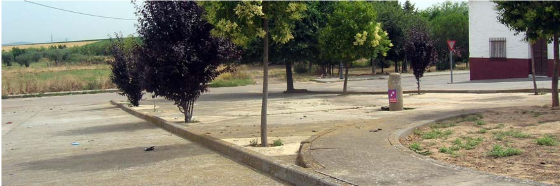
Zona de descansadero y abrevadero para el ganado transhumante

Aquí se encontraba el descansadero y abrevadero del grifo. Actualmente hay casas a ambos lados de la fuente, pero en 1870 era una zona de tierra, totalmente despejada que servía para los rebaños descansaran y bebieran.