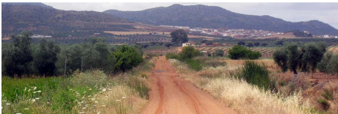
Dehesa de "Guillén". Lugar por donde la cañada se adentraba en el término de Villagonzalo

En el término de Villagonzalo, tiene una longitud aproximada de tres kilómetros, penetra en el término de Villagonzalo, procedente del de Zarza de Alange, por la Dehesa de Guillén y lleva en su interior el camino vecinal de Zarza a Villagonzalo.