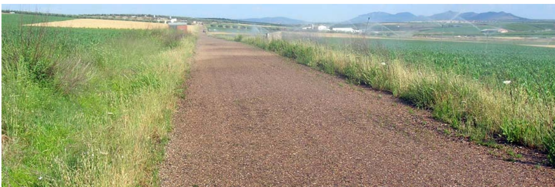
La colada de Valdeterres a su paso por el sitio de Las Laderas

Sale de la parte norte del pueblo al cruzar el arroyo de San Juan frente a la terminación de la Colada de Circunvalación. Toma como eje el del centro del camino de Villagonzalo a Valdeterres, cruza el Callejón y sigue por las Laderas.